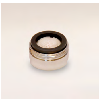
GWS4 külső menetes alacsony áteresztésű vízadagoló 4 liter/perc - 24x1