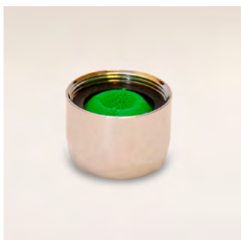
GWA 1.5 GPM belső menetes alacsony áteresztésű vízadagoló 5 liter/perc - 22x1