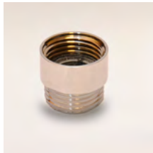
GWZ8 Zuhanyvíz adagoló 8 liter/perc