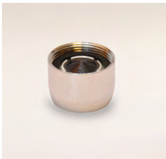
GWS8 belső menetes alacsony áteresztésű vízadagoló 8 liter/perc – 22x1