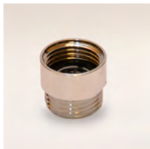
GWZ8 R Zuhanyvíz adagoló 8 liter/perc