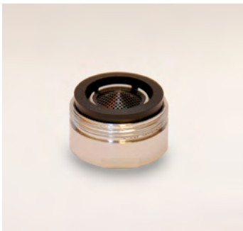
GWS8 külső menetes alacsony áteresztésű vízadagoló 8 liter/perc – 24x1