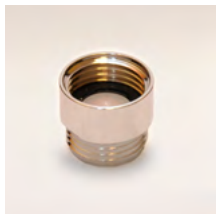
GWZ9 Zuhanyvíz adagoló 9 liter/perc