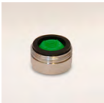
GWA 1.5 GPM külső menetes alacsony áteresztésű vízadagoló 5 liter/perc - 24x1