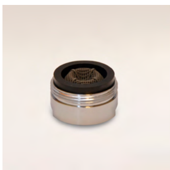
GWA 2.2 GPM külső menetes alacsony áteresztésű vízadagoló 8 liter/perc - 24x1