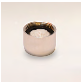
GWS4 belső menetes alacsony áteresztésű vízadagoló 4 liter/perc - 22x1