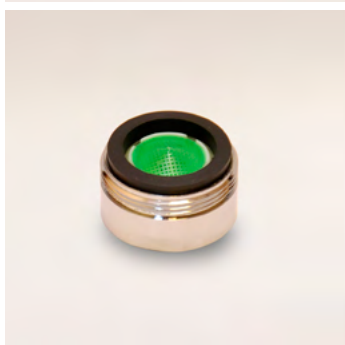
GWS5 külső menetes alacsony áteresztésű vízadagoló 5 liter/perc - 24x1