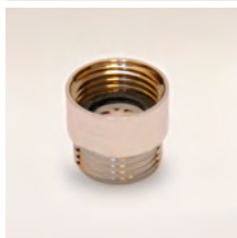
GWZ9 R Zuhanyvíz adagoló 9 liter/perc